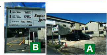
▲松尾橋東北、萩原堤「みやこ鋼管」裏